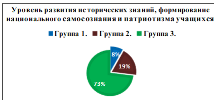
Рисунок 1. Группировка учеников по уровню развития исторических знаний, сформированности национального самосознания, самопознания и патриотизма учеников по окончании экспериментальной работы.

На основе информации таблицы приводим схему распределения учащихся по уровню развития исторических знаний, сформированности национального самопознания, самосознания и патриотизма учащихся по результатам экспериментальной работы.